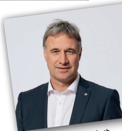
Small Talk und Simultanschach mit Marco Bode Aufsichtsratsvorsitzender, SV Werder Bremen, mehrfacher Deutscher Meister/Nationalspieler