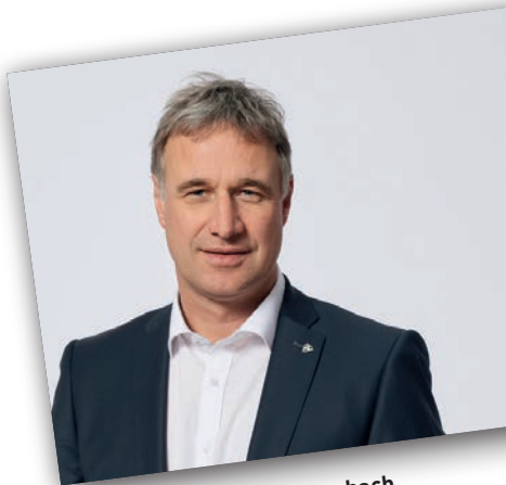
Small Talk und Simultanschach mit Marco Bode Aufsichtsratsvorsitzender, SV Werder Bremen, mehrfacher Deutscher Meister/ Nationalspieler